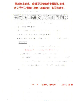
令和3年3月13日 石見銀山世界遺産センター（オンライン併用） ※例会風景、オンライン画面、例会を伝える「山陰中央新報」紙面