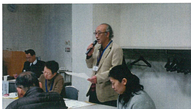
▲第2部 グループ討議②