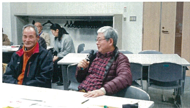
▲第2部 グループ討議③