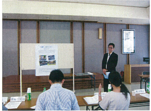
▲プレゼンテーション①