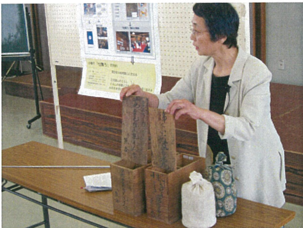
▲プレゼンテーション②