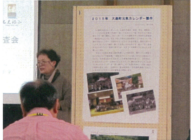
▲プレゼンテーション①