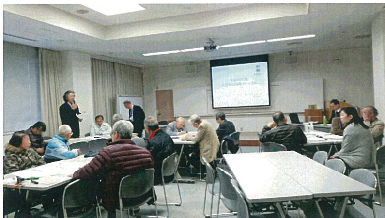
▲第2部 グループ討議①