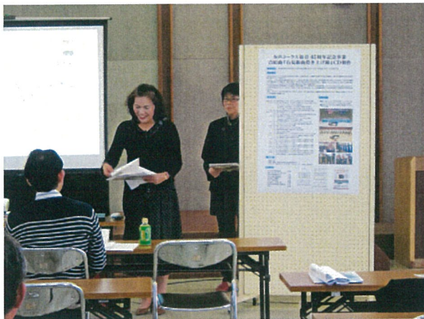
▲プレゼンテーション②